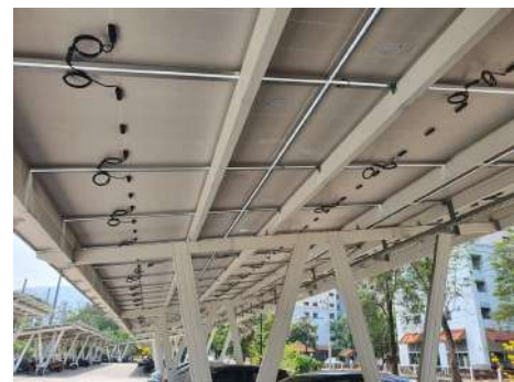
รูปที่ 4.2 ภาพตัวอย่างแสดงโรงจอดรถติดตั้งระบบผลิตไฟฟ้าด้วยแสงอาทิตย์